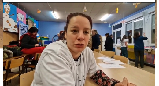
11:10 Le Bar des amis à Marseille a trouvé son nouveau chef