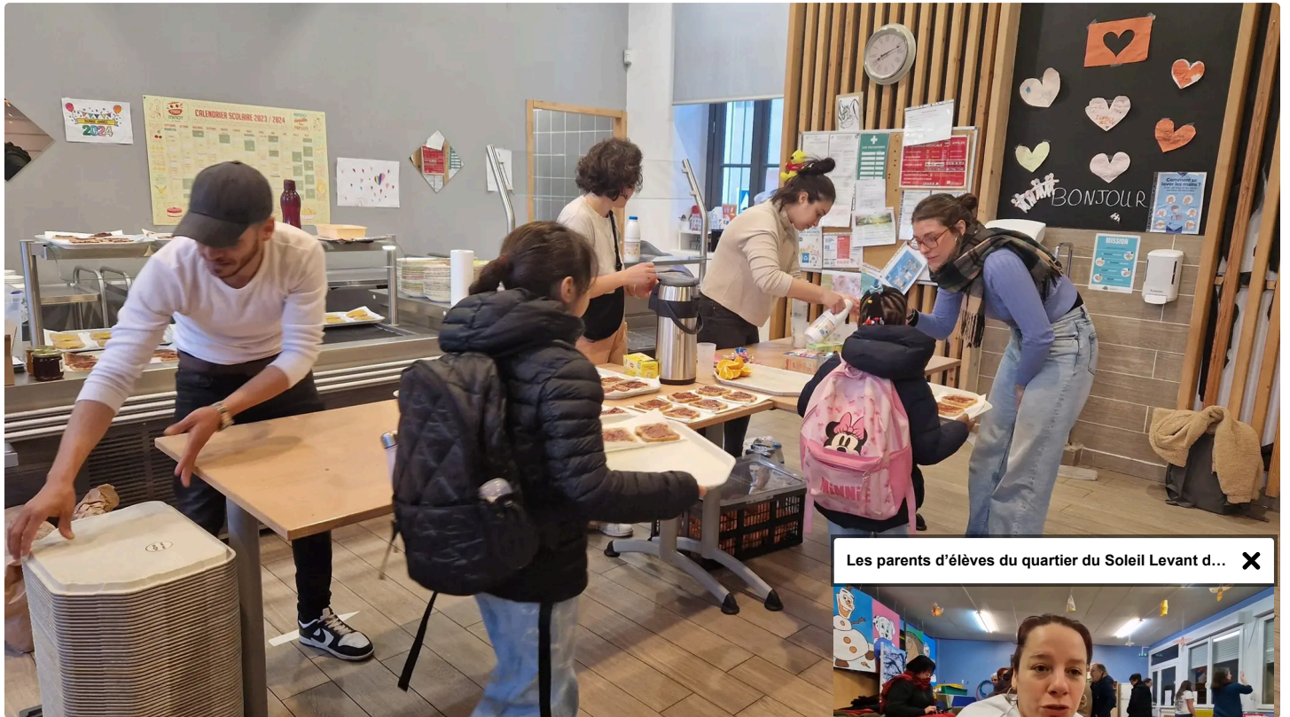
Les parents d'élèves du quartier du Soleil Levant d... X

Publié le 13/03/24 à 09:31 - Mis à jour le 13/03/24 à 11:02